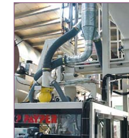
CSA 75 Sistema de aspiración de polvo De-dusting system

COLOCADOR AUTOMÁTICO DE SACOS DE BOCA ABIERTA OPEN MOUTH BAG PLACER