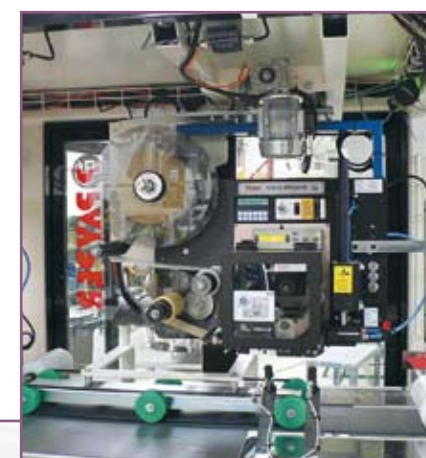
CSA 105 Estación de etiquetado Bag labelling station