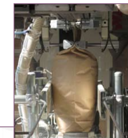
CSA 75 Extracción aire residual Extraction of residual air