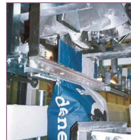
CSA 75 Sistema motorizado de arrastre del saco Sack guiding system through motorised belts