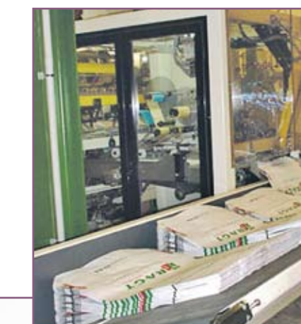
CSA 100 Almacén de sacos vacíos de gran autonomía Large autonomy empty sacks tray