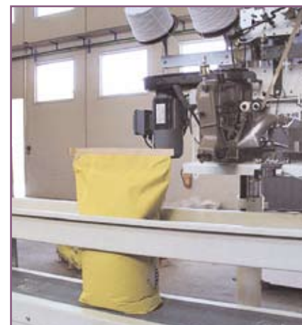
CSA 95 Acabado final del saco lleno Final looking of filled bag