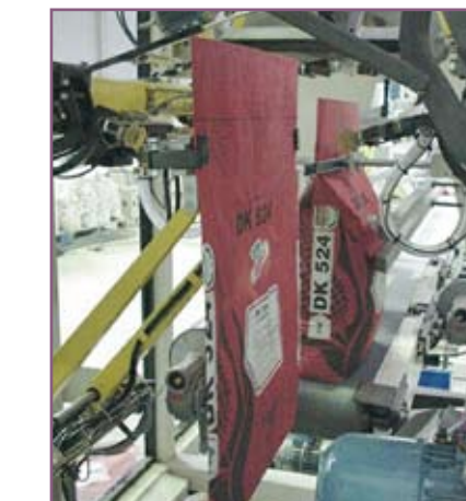
CSA 100 Colocación y estirado del saco Bag placing and stretching