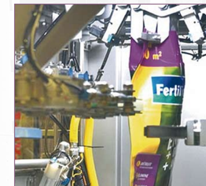
CSA 105 Manipulación de sacos con fuelles laterales Handling of side-gusseted sacks