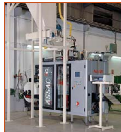
Instalaciones completas de envasado Whole bagging lines

PAYPER TECNOLOGÍA DE ENSACADO BAGGING TECHNOLOGY