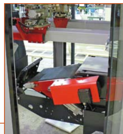
Sistema de guiado y compactación inferior Guiding system and bottom settling