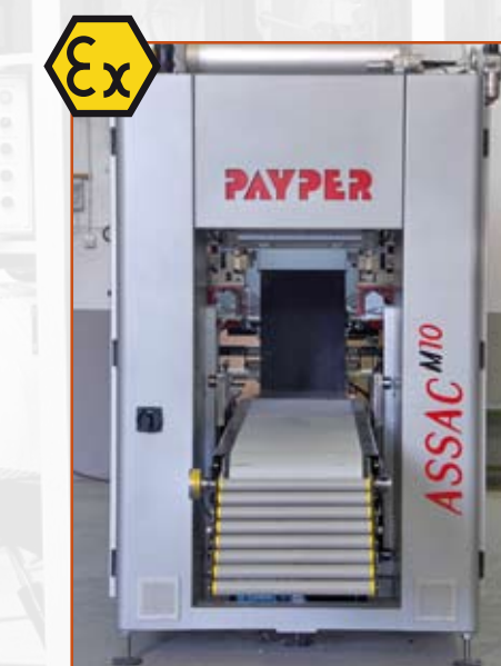
Ejecuciones especiales [ATEX] Special applications [ATEX]