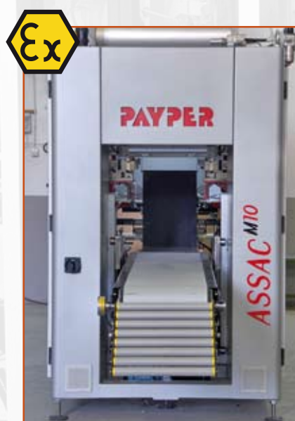
Ejecuciones especiales [ATEX] Special applications [ATEX]