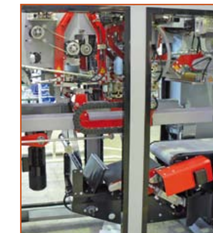
Vista Interior L10 Inner view L10