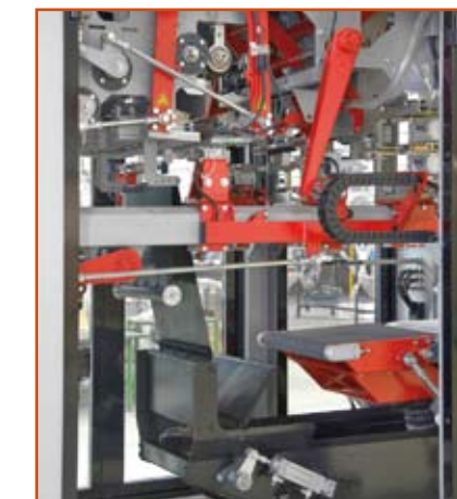
Vista Interior M10 Inner view M10