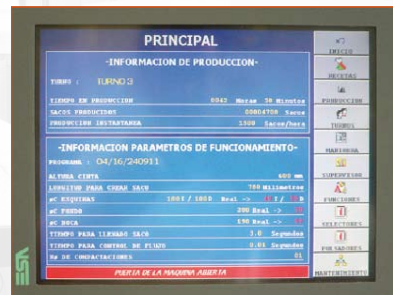
Pantalla de control de producción Touch-Screen for output control