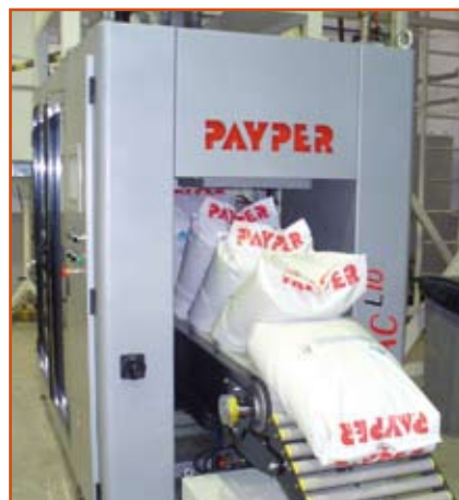
Evacuación de sacos llenos Filled bags exit