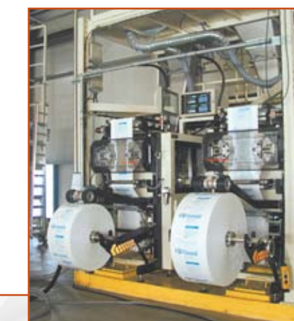
Plataforma desplazable bajo silos Moveable platform under silos battery