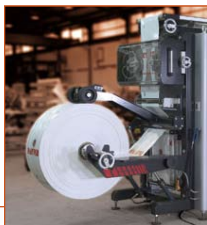
Elevador hidráulico de bobinas Hydraulic rolls lifting device